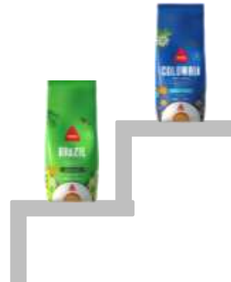
Colombia 500g Brasil 500g