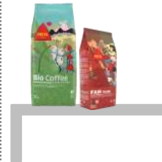
BioCoffee 1Kg Fair Trade 500g