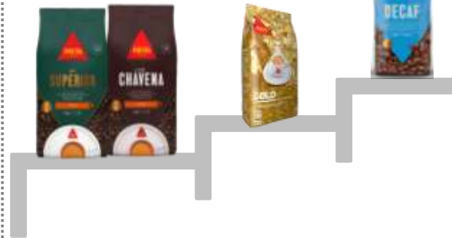
Decaf 500g Gold 500g Chavena 1Kg / 250g Superior 1Kg