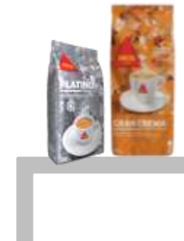
Platinum 500g Gran Crema 1Kg