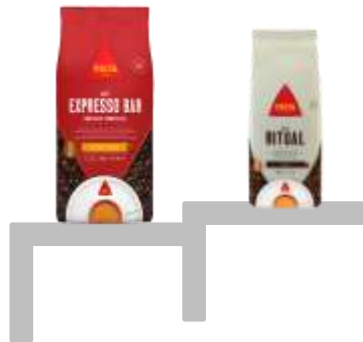
Ritual 500g Espresso Bar 1Kg